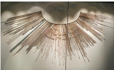
↑ インカのキープ →